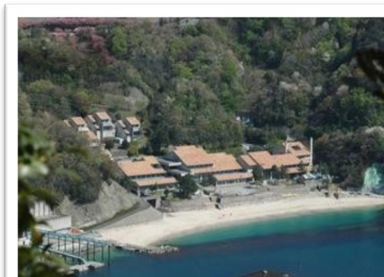
若狭湾青少年自然の家