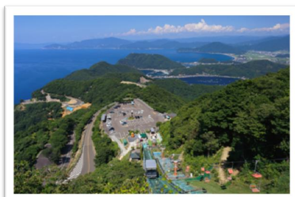
三方五湖レインボーライン