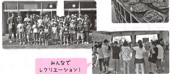
みんなで レクリエーション!

【日 時】成30年9月9日(土)~10日(日) 【行き先】富山県呉羽青少年自然の家 富山市電(LRT)乗車体験、 四季防災館、科学博物館