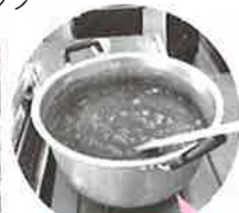
毎年恒例の カレーライス!