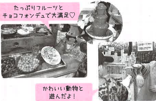
かわいい動物と 遊んだよ!